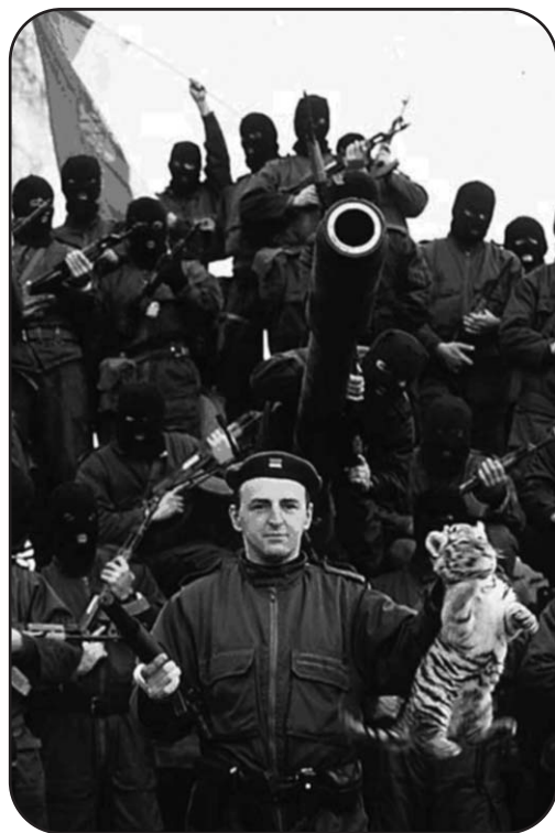
Ζέλικο Ρασνάντοβιτς, ή Αρκάν. Γιος στρατιωτικού, πράκτορας των μυστικών υπηρεσιών, αρχηγός των φανατικών οπαδών της ομάδας του Ερυθρού Αστέρα, ληστής τραπεζών, αρχινόνος, λαθρέμπορος, φασίστας, αρχηγός της παραστρατιωτικής ομάδας Τίγρεις, υπεύθυνος για την σφαγή χιλιάδων μουσουλμάνων, καταζητούμενος από το δικαστήριο της Χάγης για εγκλήματα πολέμου. Θα πεθάνει τον Γενάρη του 2000 σε ηλικία 47 χρόνων. Στην φωτο κρατώντας το έμβλημα της ομάδας, ένα μικρό τίγρη.

Στην Γερμανία, όπου ο Έλληνας νονός μεταβαίνει για να γλιτώσει τα αντίποινα, βρίσκεται ήδη ο παραστρατιωτικός Ζέλικο Ρασνάντοβιτς, ή αλλιώς Αρκάν . Ο Αρκάν ήταν στρατολογημένος από τις μυστικές υπηρεσίες της χώρας του από τα μέσα της δεκαετίας του '70. Πνευματικό παιδί του αρχηγού των μυστικών υπηρεσιών Stane Dolanc , είχε σαν μία από τις αποστολές του να εκτελεί πρόσφυγες που είχαν ζητήσει πολιτικό άσυλο σε χώρες της Ευρώπης. Παράλληλα οι δραστηριότητές του στην "νύχτα" ήταν αξιοθαύμαστες. Είχε υπό τον έλεγχό του μεγάλο αριθμό νυχτερινών κέντρων στην πρώην Γιουγκοσλαβία και είχε αρχίσει να επεκτείνεται και εκτός συνόρων - στη Γερμανία ήταν ήδη