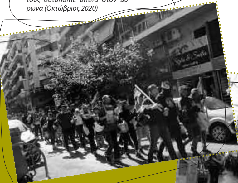
Διαδήλωση στόμα με στόμα από τους autonome antifa στον Βύρωνα (Οκτώβριος 2020)

Ο υπόγειος κόσμος μας ακούει για «περισσότερα τεστ» και φεύγει τρέχοντας. Ακούει για «μέτρα προστασίας» και χλευάζει. Ακούει για «δημόσια υγεία» και γυρίζει την πλάτη. Γι' αυτό ακριβώς συνεχίζουμε και επιμένουμε με τα «απαγορευμένα» ζητήματα. Που δεν είναι άλλα, από τα ταξικά ζητήματα.