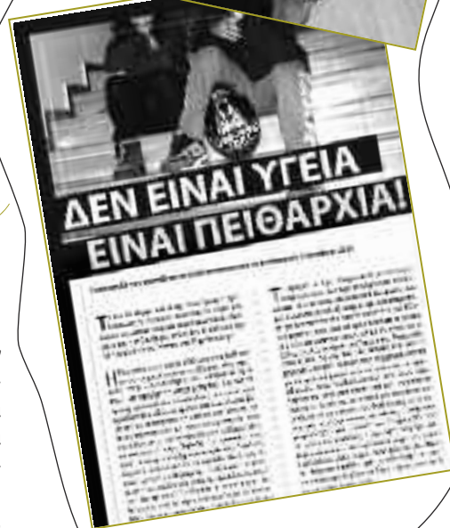
Αφίσες- έντυπα που κυκλοφόρησαν σε χιλιάδες αντίτυπα στις γειτονίες της Αθήνας (Οκτώβριος 2020)