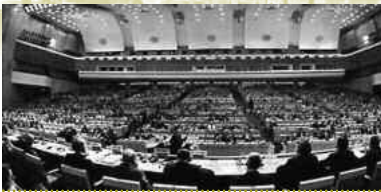
«Διεθνής Διάσκεψη για την Πρωτοβάθμια Φροντίδα Υγείας». Παλάτι του Λένιν, Άλμα Άτα, Σοβιετική Ένωση, 6-12/9/1978. Μιλάμε για σοσιαλισμό, όχι αστεία.