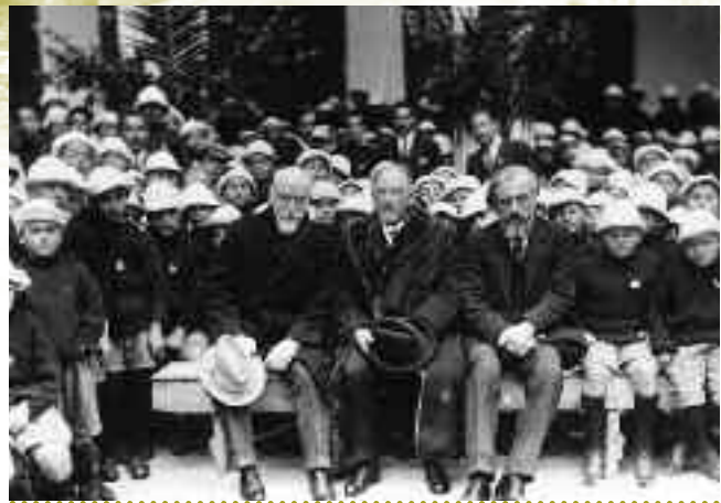
Ο Βενιζέλος και παραδίπλα ο ευγονιστής Απόστολος Δοξιάδης με προσφυγόπουλα το 1924