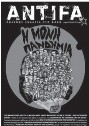
Περιοδικό Antifa: Πόλεμος Ενάντια στο Φόβο

Με λίγα λόγια, εδώ κι ένα χρόνο δεξιοί κι αριστεροί μας κλειδώσανε μαζί φροντίζοντας να πειθαρχήσουν, να συσκοτίσουν και να εφαρμόσουν την πολιτική του ελληνικού κράτους με όσο το δυνατόν μικρότερες αντιδράσεις. Και τελικά σε άλλη μία κρίσιμη στιγμή απέδειξαν ότι όσο φωναχτά διαφωνούν για τα σήμαντα, τόσο συμφωνούν σιωπηλά για τα σημαντικά που διακυβεύονται προετοιμάζοντας την επίθεση τους εις βάρος της εργατικής τάξης.