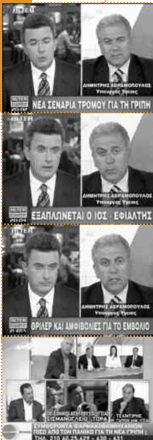
Σταχυολόγηση τηλεπαραθύρων από την προβολή της γρίπης H1N1 το καλοκαίρι του 2009. Μίγμα μέτριας (με τα σημερινά δεδομένα) τρομοκρατίας κι αμφιβολίας για το εμβόλιο (εφόσον η ελληνική φαρμακοβιομηχανία μένει απ' έξω).

τους που έβλεπε μέσα από τον κύκλο της υγείας την κρίση του να μετατίθεται για αργότερα. Την ίδια στιγμή και μέσω αυτής της πολιτικής, η ντόπια φαρμακοβιομηχανία πήρε τα πάνω της, αντλώντας συνεχώς χρήμα από τα ταμεία ασφάλισης. 5