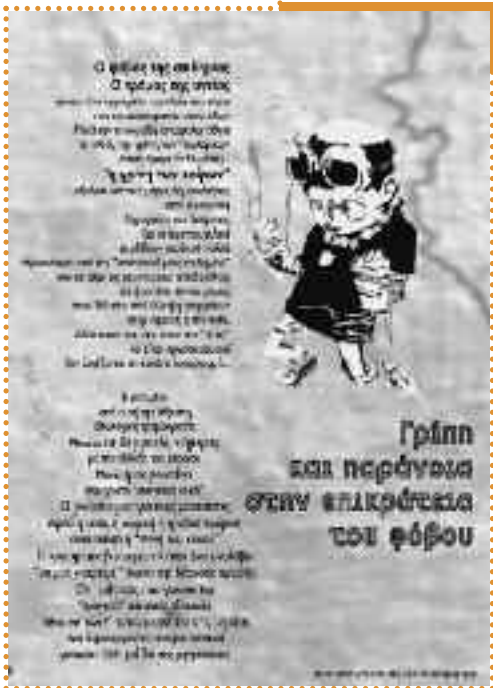
Αφίσα που κολλήθηκε στη Θεσσαλονίκη τον Μάιο του 2009, από τη Συνέλευση Ενάντια στο Νέο Ολοκληρωτισμό. Αν και είχαμε αντιληφθεί από τότε ότι η γριποτρέλα δεν ήταν μια αμελητέα υπόθεση, σίγουρα δεν φανταζόμασταν με τίποτα το πού μπορούσε να φτάσει το 2020.

οποίος σκότωσε μισό εκατομμύριο αμερικανούς και 20 εκατομμύρια άτομα παγκοσμίως. Μέσα σε μερικές ημέρες, τα συμπτώματα του συνδρόμου Guillain-Barre αναφέρθηκαν ανάμεσα σε αυτούς που είχαν κάνει το εμβόλιο και 25 από αυτούς πέθαναν από αναπνευστικό πρόβλημα λόγω γενικευμένης παράλυσης. Η παρενέργεια εμφανίστηκε σε έναν στους 80.000 ανθρώπους, σε αντίθεση με το ένα άτομο που πέθανε από την ίδια τη γρίπη, ενώ 40 εκατομμύρια αμερικανοί είχαν κάνει το εμβόλιο στη διάρκεια των 10 εβδομάδων που χρειάστηκαν για να διακοπεί, τελικά, το εμβολιαστικό πρόγραμμα. 12