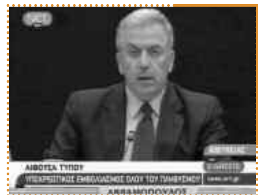
Ο Αβραμόπουλος τον Ιούλιο του 2009 εισηγείται υποχρεωτικό εμβολιασμό. Τελικά ο εμβολιασμός όχι μόνο δεν ήταν υποχρεωτικός, αλλά το ίδιο το κράτος υπονόμεισε διακριτικά την αξία των εμβολίων, καθώς έβλεπε αφενός τα υπόλοιπα κράτη να μην ψήνονται να πάρουν την «πανδημία» στα σοβαρά, αφετέρου την ελληνική φαρμακοβιομηχανία να μην κερδίζει όσα θα ήθελε.

Την ίδια στιγμή, το ελληνικό κράτος άρχισε να ανησυχεί για τον τουρισμό και παρακολουθούσε τις κινήσεις των άλλων κρατών. 8 Στα τέλη Ιουλίου του 2009, ο υπουργός Υγείας Δ. Αβραμόπουλος εξήγειλε το «Εθνικό Σχέδιο Πανδημίας Γρίπης», το οποίο βασιζόταν στο σχέδιο «Αρτεμις» που είχε καταρτιστεί για τους ολυμπιακούς αγώνες. Ταυτόχρονα, ο Αβραμόπουλος διαβεβαίωνε ότι έχουμε τα λιγότερα κρούσματα στην Ευρώπη. Τα μήντια ρίχνανε μέτριες δόσεις τρομοκρατίας επισημαίνοντας διακριτικά ότι ο πολύς πανικός μπορεί να επηρεάσει αρνητικά τον τουρισμό του Αυγούστου. 9