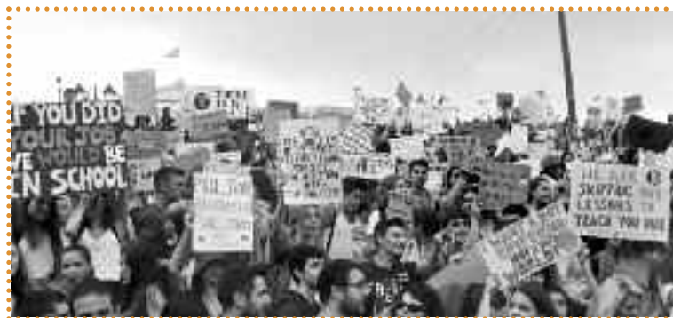
Δείγμα του βραχύβιου κινήματος «Παρασκευές για το μέλλον». Αν ρωτάτε πώς οργανώνονται κάτι τέτοια, ιδέα δεν έχουμε, αλλά υποπτευόμαστε συνδυασμό Σύριζα-Σχολής Μωραΐτη.

Ωραία που ήταν στις αρχές του σχολικού έτους 2019-2020! Οι συγκεντρώσεις επιτρέπονταν - τόσο πολύ, που ορισμένοι Έλληνες μαθητές και μαθήτριες χρησιμοποιούσαν εκείνο το ξεχασμένο κι απαράγραπτο δικαίωμα για να μαζεύονται κάθε Παρασκευή του Σεπτεμβρη στο Σύνταγμα και να υψώνουν πλακάτ «για το περιβάλλον». Αυτό το φασέικο πράγμα ήταν λέει «κίνημα», και λεγόταν «Παρασκευές για την Παλ...» -εεε, σόρυ αυτό ήταν άλλο- λεγόταν «Παρασκευές για το μέλλον». Οι είλωτες του «κινήματος» δεν έμειναν στην ιστορία, οι ηγέτες όμως πήγαιναν σε ιδιωτικά σχολεία, ήταν βίγκαν, αγόραζαν ρούχα από δεύτερο χέρι και έπιναν νερό από παγούρι κι όχι από πλαστικό μπουκάλι. Ο προβολέας της επικαιρότητας που έπεφτε πάνω τους, επέτρεπε ακόμη και μια ματιά στα πολιτικά τους πιστεύω. Όπως τα έλεγε η νεαρή βίγκαν με το παγούρινο, «το #Fridays for Future δεν είναι ένα κομματικοποιημένο κίνημα. Δεν είναι ούτε χίπικο, ούτε κομμουνιστικό, ούτε δεξιό». 1