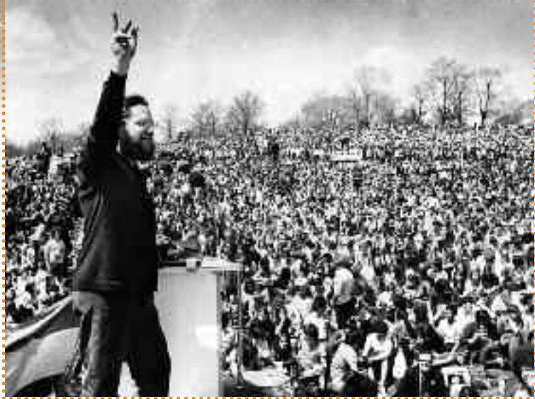
Εκδήλωση κατά την «Ημέρα της Γης», Απρίλιος, 1970. Προσέξτε τον συνδυασμό γραβάτας – αφάνας κάτω δεξιά.

Έπρεπε τέλος αυτοί οι οργανισμοί να αποκτήσουν εξουσία. Αυτή η εξουσία θα μπορούσε να ασκείται σε περιοχές όπου η κυριαρχία του έθνους κράτους έως τότε δεν έφτανε, όπως «το διάστημα, οι πόλοι, ο βυθός του ωκεανού» (403). Σε αυτές τις περιοχές, αλλά και γενικώς, ένας τέτοιος οργανισμός θα μπορούσε να παίξει το ρόλο του «μαντρόσκυλου» σε περιπτώσεις που «το κίνητρο της εκμετάλλευσης και το κίνητρο της διατήρησης [της φύσης] έρχονται σε σύγκρουση».