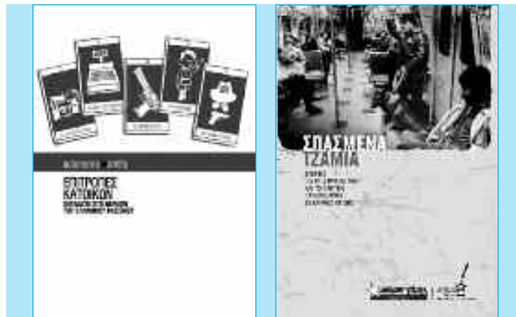
Εκδόσεις ενάντια στον σύγχρονο φασισμό και το δόγμα της μηδενικής ανοχής.

συμφέροντα. Άλλοτε με το μαγαζάτορα, άλλοτε με το ρουφιάνο της γειτονιάς κι άλλοτε με τη μαφία.