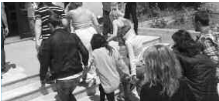
Οι οροθετικές γυναίκες που συνελήφθησαν το 2012 οδηγούνται στο δικαστήριο. Διαπομπεύθηκαν και κατηγορήθηκαν βάσει νόμου για τον «περιορισμό διάδοσης λοιμωδών νοσημάτων».

Το 2012, το κράτος αποφάσισε για «λόγους δημόσιας υγείας» να συλλάβει και να διαπομπεύσει 11 οροθετικές γυναίκες στο κέντρο της Αθήνας. Συγκλονιστήκαμε αλλά και συγκρατήσαμε στη συλλογική μας μνήμη το γεγονός ότι τη βρώμικη δουλειά δεν την έκαναν μόνο μπάτσοι, αλλά και γιατροί. Το εγχείρημα συκοφάντησης κομματιών της τάξης μας ως «υγειονομική απειλή» που έλαβε χώρα το 2012 θα ήταν αδύνατο χωρίς τη συμβολή του τότε ΚΕΕΛΠΝΟ (νυν ΕΟΔΥ). Γεγονός που αποκάλυπτε τον πραγματικό χαρακτήρα και τις αληθινές στοχεύσεις των υγειονομικών θεσμών.