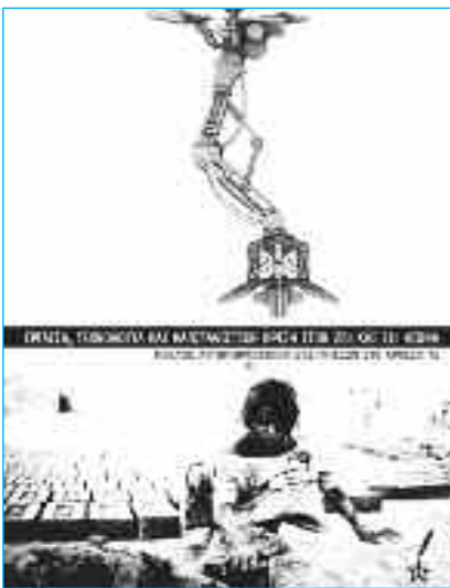
Ο κύκλος αυτομορφωτικών συναντήσεων με τίτλο «Εργασία, Τεχνολογία και καπιταλιστική κρίση στον 20ο και 21ο αιώνα» που οργανώσαμε το 2012-2013.