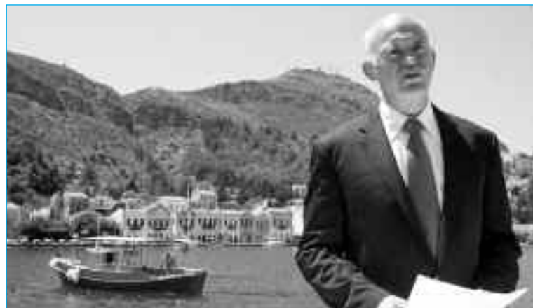
Ο Γ. Παπανδρέου ανακοινώνει από το Καστελόριζο την προσφυγή στο ΔΝΤ και τον ευρωπαϊκό μηχανισμό στήριξης, Απρίλιος 2010. Ατενίζει μάλλον την ΑΟΖ..

Τα τελευταία δέκα χρόνια ωστόσο συνειδητοποιήσαμε ότι τα καπιταλιστικά κράτη εμπλέκονται σε παγκόσμια διακρατική σύγκρουση από το τέλος του ψυχρού πολέμου κι έπειτα. Ότι τα πολεμικά συμβάντα των τελευταίων τριάντα χρόνων (ο πρώτος πόλεμος του Κόλπου, η διάλυση της Γιουγκοσλαβίας, η εισβολή των ΗΠΑ στο Ιράκ και το Αφγανιστάν, η διάλυση της Μέσης Ανατολής, οι συγκρούσεις στην Ουκρανία και τα κράτη του Καυκάσου, οι στρατιωτικές επιχειρήσεις στην Αφρική) δεν είναι μεμονωμένα συμβάντα. Είναι η παγκόσμια διακρατική σύγκρουση που εξελίσσεται για το νέο μοίρασμα του κόσμου. Και σε αυτή τη σύγκρουση συμμετέχουν όλα τα καπιταλιστικά κράτη ανάλογα με τα δικά τους, επιμέρους εθνικά συμφέροντα.