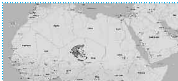
Αυτή τη φωτό τη φτιάξαμε με εργαλεία του google, τοποθετώντας το ελληνικό κράτος στην αχανή «ζώνη του Σαχέλ». Για να καταλάβουμε σε τι έκταση αναφέρονται οι «ελληνικές επιδιώξεις».