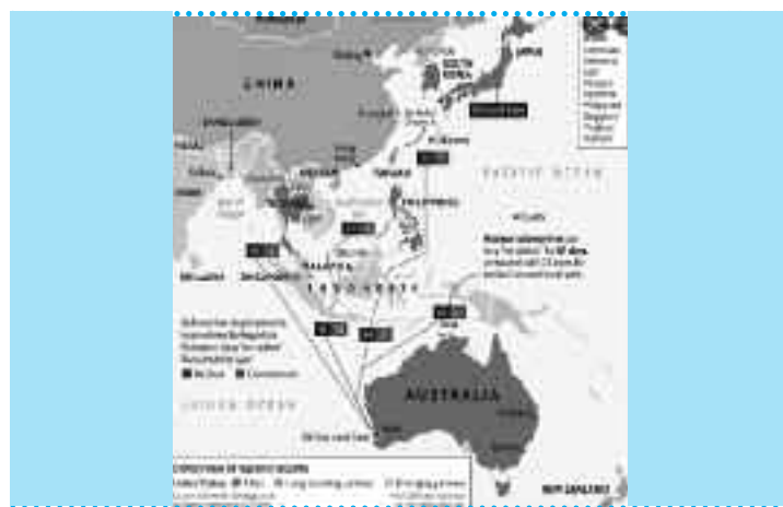
Η περιοχή του Ινδοειρηνικού Ωκεανού και τα κράτη που μάχονται μέσω συμμαχιών για τον έλεγχό του.