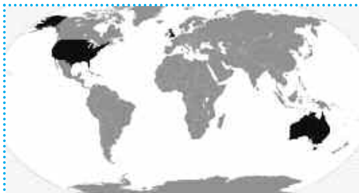
Χάρτης που απεικονίζει τη συμμαχία AUKUS και τη θέση της στον πλανήτη.

Ο όρος «Ινδοειρηνικός» είχε επισήμως λανσαριστεί από το 2011 επί Ομπάμα για να περιγράψει την περιοχή που θα αποτελούσε «ύψιστο στρατηγικού ενδιαφέροντος» για τις ΗΠΑ, τον υιοθέτησε ο τρελός φασίστας Τραμπ και τον ενστερνίστηκε με ζέση ο λογικός democrat Μπάιντεν, κατά την απαράβατη στρατηγική «οι πρόεδροι έρχονται και παρέρχονται, η εξωτερική πολιτική παραμένει». Ο «Ινδοειρηνικός» αναφέρεται στη θαλάσσια περιοχή νοτιανατολικά της Κίνας όπου διεξάγεται με πλοία ένα σημαντικό κομμάτι του διεθνούς –και κυρίως κινεζικού- εμπορίου. Η συμφωνία AUKUS προβλέπει ότι στα βάθη του Ινδοειρηνικού θα πλέουν οκτώ πυρηνοκίνητα υποβρύχια τα οποία θα προμηθευτεί η Αυστραλία από τις ΗΠΑ. 3