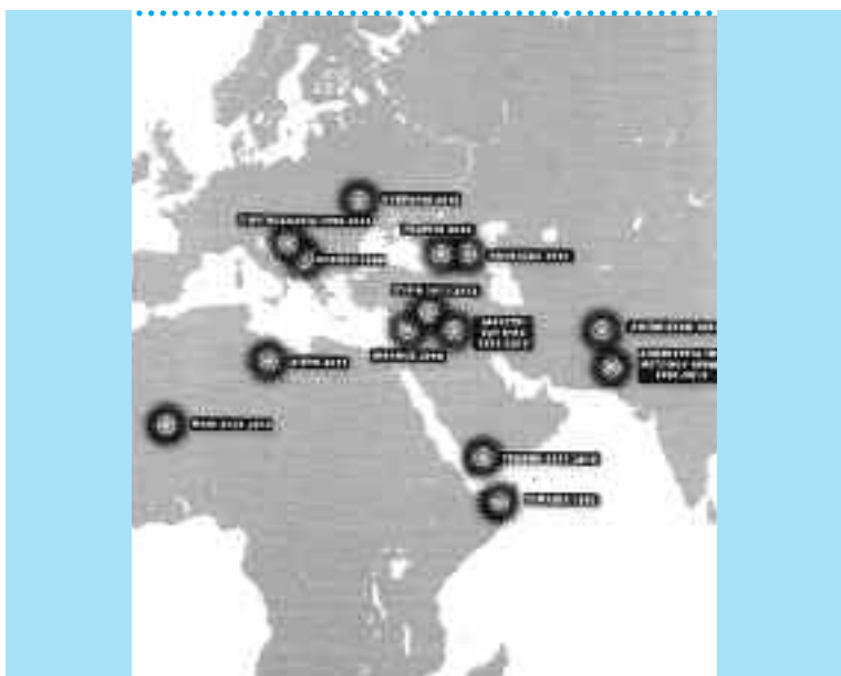
Η παγκόσμια σύγκρουση 1991-2015.

Η πρώτη πράξη του μεταψυχροπολεμικού παγκόσμιου πολέμου ήταν η επίθεση των ΗΠΑ και άλλων συμμάχων τους στο Ιράκ το 1991 (ο λεγόμενος πρώτος «Πόλεμος του Κόλπου»). Η επίθεση λειτούργησε ως παρακαταθήκη για τη μελλοντική διάλυση του ιρακινού κράτους. Αλλά και ως εργαλείο ελέγχου της παραγωγής πετρελαίου, το οποίο τροφοδοτούσε εκτός των άλλων τον γερμανικό και κινεζικό καπιταλισμό.