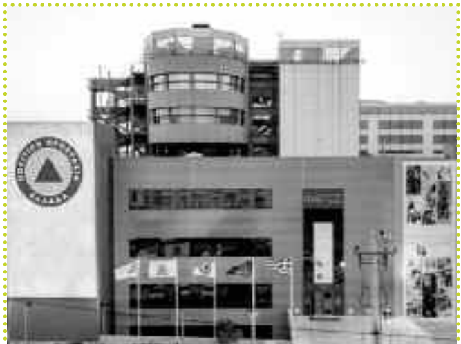
Το κτίριο της Στατιστικής Υπηρεσίας στο Βερολίνο. Γατάκια... Δείτε δεξιά. Αν φέρνεις εις πέρας την καταγραφή και την πειθάρχηση ολόκληρης της εργατικής τάξης, σου αξίζει ο πύργος του Κόμη Δράκουλα με πινελιές από το Death Star!

κάνει κριτική σε τίποτα, αφού η επόμενη έκπληξη μπορεί να τουμπάρει τα πάντα. Μάλλον θα καταλήξει να αγαπάει δίχως αύριο τους γιατρούς, τους δικαστές, τον ΟΑΕΔ, ίσως ακόμη και την αστυνομία και να φοβάται μην πέσουν ποτέ στα χέρια του Μιχαηλιάκου.