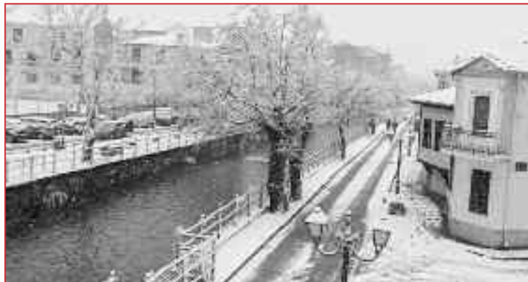
Η κακοκαιρία Φίλιππος (2/2) ήταν κι αυτή «πρωτοφανής». Δηλαδή να φανταστείτε «χιόνισε στη Φλώρινα»... Πήγε τόσο άπατη που και την επόμενη (10/3) πάλι Φίλιππο την είπανε μπας και ρεφάρουν.

Με άλλα λόγια, τα βαφτίσια στις κακοκαιρίες κρίνονται αποτελεσματικά, όχι