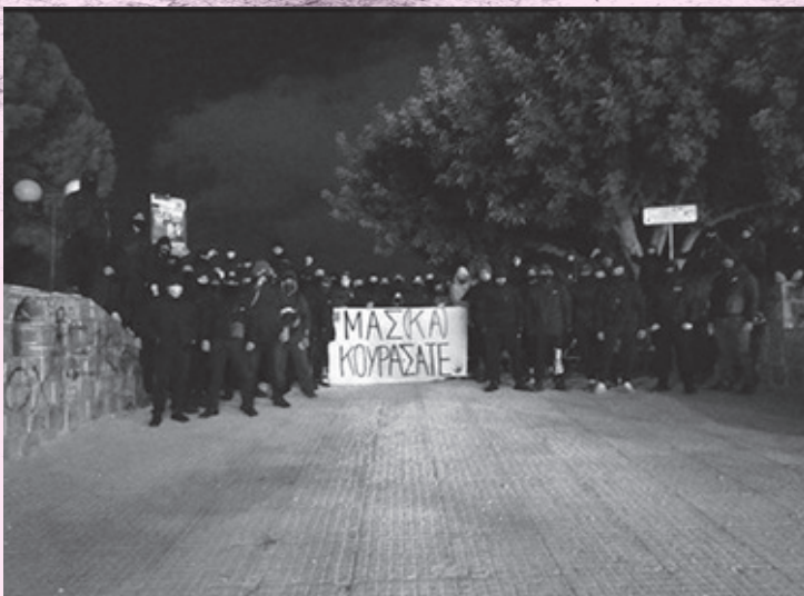
Διαδήλωση στο Μπραχάμι, Δεκέμβρης 2020.