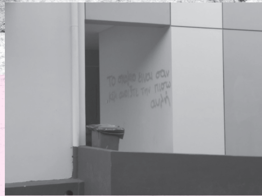
Χαλάνδρι: Η «πίσω αυλή». Αλλού το λένε Τζούρα κλαμπ!

με». Το σύνθημα «Γιόνκα Μαγιόνκα και βγάλτε τις μάσκες» είναι κατανοητό από τους γνωρίζοντες, οι υπόλοιποι ας γκουγκλάρουν. Αλλά η αντιπειθαρχική μάχη δε σταματούσε στη μάσκα. Κάπου στο Χολαργό οι καταληψίες βρέθηκαν να διαμαρτύρονται για το κλείσιμο του καπνιστηρίου με τη φράση «το σχολείο είναι σαν κελί, ανοίξτε μας την πίσω αυλή». Ένας από αυτούς περιέγραψε πώς είχαν χάσει το καπνιστήριο και μαζί τη μοντέρνα διαπλοκή «υγειονομικών μέτρων» και σχολικής πειθαρχίας: