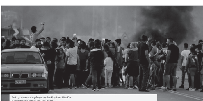
Από τη συγκέντρωση διαμαρτυρίας Ρομά στη Νέα Κιο

Αλλά, όπως είδαμε, και οι αριστεροί είχαν αρκετό καιρό για να μάθουν να αντιμετωπίζουν το ταξικό μίσος. Κουβαλήθηκαν στο εγκληματικό ΕΠΑΛ για να φάνε ξύλο. Την άλλη μέρα ξανακουβαλήθηκαν. Τώρα δεν ήταν σκέτη νεολαία Σύριζα. Μαζί τους είχαν και τους ενήλικους, δηλαδή τις τοπικές ΕΛΜΕ και όλα τα υπόλοιπα είδη συριζαίων εργατοβοσκών. Όλοι αυτοί ήταν έτοιμοι να τραβήξουν (και να μοντάρουν) ταινίες για το γιουτιούμπ. Οι εικόνες που προέκυψαν ήταν η πιο ξεκάθαρα συμβολική επίκληση του ταξικού χάσματος που έχουμε δει ποτέ μας. Αλληπάλληλα βίντεο με τρελλούς ακροδεξιούς της εργατικής τάξης και σόφρωνες αριστερούς της μεσαίας τάξης πήγαν από το ένα καλώδιο στο άλλο σαν τα αλίστου μνήμης βίντεο από τις περιπέτειες της Χρυσής Αυγής στις λαϊκές αγορές. 16 Ακολούθησαν κοινωνιολογικές αναλύσεις στα πλαίσια των οποίων ο «φασισμός» αναδείχθηκε για άλλη μια φορά ως βούρλισμα των φτωχών που θα θεραπεύσουν οι