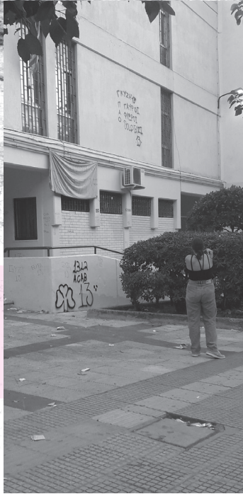
Γκύζη. Το ροζ πανώ ανέβηκε ενάντια στον «ομοφοβικό διευθυντή μας».