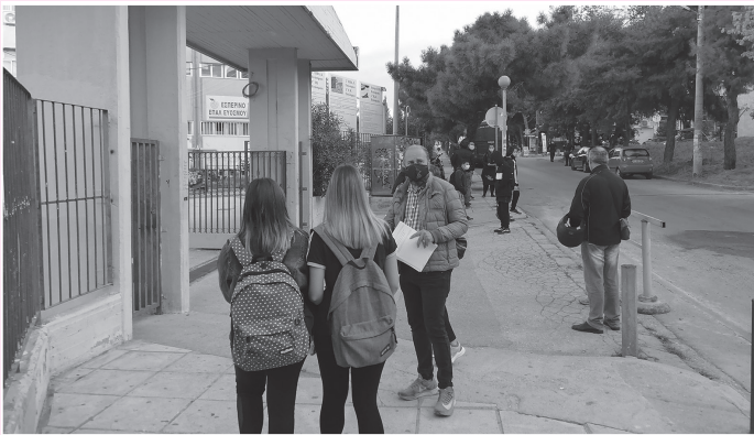
Μπροστά σάπιος αριστερός και στο βάθος κλούβα. Η αντιεξέγερση στη Δυτική Θεσσαλονίκη, Φθινόπωρο 2021.

Δείτε το σαν αποτέλεσμα των πεπραγμένων μας κατά τη διάρκεια των δύο τελευταίων χρόνων. Θα νιώσετε καλύτερα.