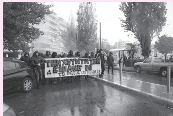
Διαδήλωση στον Πειραιά, Δεκέμβρης 2020.