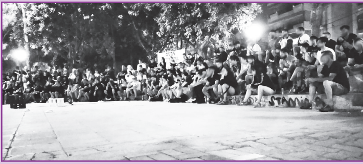
Η μάχη για τον δημόσιο χώρο από τη δική μας μεριά. Στιγμιότυπο από την εκδήλωση του antifa north.

Η μεταστροφή που συνέβη από εκείνη την ώρα και έπειτα στο πάρκο, ήταν επίσης εντυπωσιακή. Το αμφιθέατρο γέμισε από εμάς και τους φίλους μας. Είδαμε το ντοκιμαντέρ και μιλήσαμε, σαν άνθρωποι, για αυτά που μας συμβαίνουν. Επίσης, το πάρκο είχε αρχίσει να αποκτά τη δική του ζωή, όπως κάθε βράδυ. Ξέρετε, από αυτή που καθόλου δεν αρέσει στο κράτος. Παρέες που αράζουν εκεί έτσι κι αλλιώς, ήρθαν και άραξαν στον χώρο τους. Όχι απαραίτητα για να παρακολουθήσουν την εκδήλωση. Κάποιοι την παρακολούθησαν. Αλλά και μόνο η ύπαρξη των φυσικών θαμώνων του πάρκου, η συνύπαρξη μεταξύ μας, δείχνει μια ανοχή, αν όχι αμοιβαίο σεβασμό. Μας φέρνει από την ίδια μεριά στη μάχη για τον δημόσιο χώρο. Όπως και να το κάνεις, είναι ένα κοινό. Η σκέψη αυτή μας έκανε πολύ χαρούμενες στο τέλος της ημέρας.