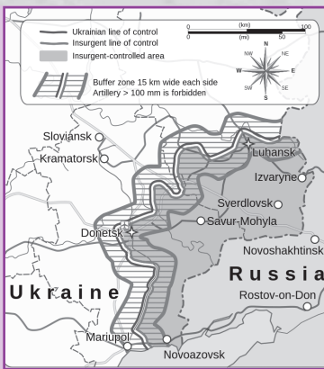
Χάρτης που δείχνει τις ανατολικές επαρχίες της Ουκρανίας που de facto αποσχίστηκαν το 2014.

ότι διάφορες ευρωπαϊκές χώρες θέλουν παρασκηνιακά ακριβώς το ίδιο, άσχετα αν άλλα λένε δημοσίως. Ο ρωσο-ουκρανικός πόλεμος εντείνει την αποσταθεροποίηση των πολιτικών, αλλά και κοινωνικών ισορροπιών στην Ευρώπη και το κάθε κράτος αποζητεί τη διατήρηση των δεδομένων αυτών που το συμφέρουν. Το σημαντικότερο ζήτημα όμως για την Ευρώπη ήταν πάντα το τι θέλει και τι κάνει η μεγαλύτερη δύναμη στην ήπειρο, δηλαδή η Γερμανία.