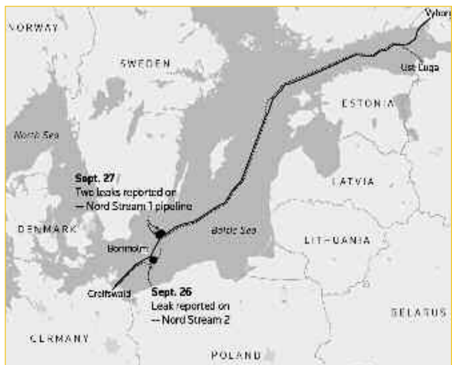
Εικόνα 5: Οι μυστηριώδεις διαρροές των αγωγών Nord Stream απεικονίζονται στο χάρτη. Ο ίδιος χάρτης μάς θυμίζει τον πραγματικό διεθνή ρόλο των σκανδιναβικών κρατών. Που δεν είναι η προώθηση του «κοινωνικού κράτους», αλλά το θαλάσσιο οδόφραγμα ενάντια σε Ρώσους και Γερμανούς.

Κι έτσι, η τριακονταετής σύγκρουση εξελίσσεται. Και όσο εξελίσσεται, τόσο πλησιάζει την ελληνική επικράτεια. Για την οποία θα πρέπει να μιλήσουμε ξεχωριστά.