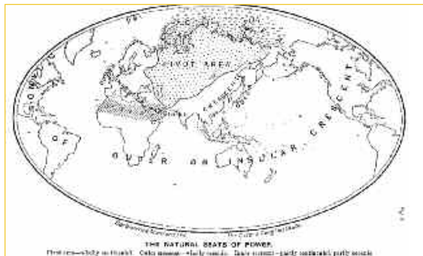
Εικόνα 1: Ο χάρτης του κόσμου κατά Μάκιντερ εξέφραζε το πλανητικό βλέμμα της Βρετανικής Αυτοκρατορίας.

Οπότε, αφού είχε αποδείξει τόσο καλά τη χρησιμότητά της, η θεωρία του νησιού συνέχισε να ασκεί τη γοητεία της επί χιλιάδες χρόνια. Στην εικόνα 1 υπενθυμίζουμε ένα χάρτη παρμένο από τις παλιές μας περιηγήσεις στον κόσμο των αφεντικών.