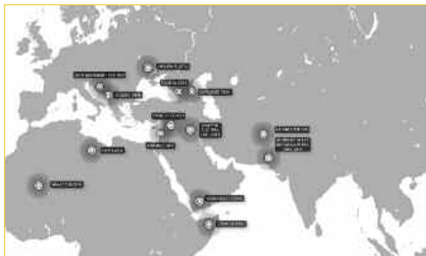
Εικόνα 4: Η στρατηγική της ανάσχεσης στον 21ο αιώνα.

Ενώσω τέτοιες όμορφες σκέψεις περίμεναν να γίνουν πράξη, ο επόμενος παγκόσμιος πόλεμος είχε ήδη ξεκινήσει. Το 1991 οι ΗΠΑ ξεκίνησαν τον πόλεμο που δώδεκα χρόνια αργότερα θα κατέληγε στη διάλυση του Ιράκ. Από το 1991 μέχρι το 1999 η διάλυση της Γιουγκοσλαβίας οργανώθηκε ώστε το ρωσικό κράτος να χάσει τα πατήματά του στα Βαλκάνια. Οι διαλυτικές τάσεις στον «δακτύλιο της ανάσχεσης» αναπτύχθηκαν από το 2001 και μετά, πρώτα στο Αφγανιστάν (2001), έπειτα στο Ιράκ (2003) και το Λίβανο (2006). Από την κρίση του 2009 και μετά, η διάλυση ανέβασε στροφές και επεκτάθηκε στη Συρία (2011), στη Λιβύη (2011), στην Υεμένη (2011), και τώρα τελευταία στην Ουκρανία (2014, 2022). Ο χάρτης της εικόνας 4 δείχνει την εξέλιξη της στρατηγικής της ανάσχεσης στον 21ο αιώνα. 13