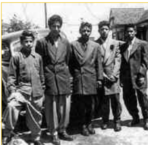
Έφηβοι πατσούκος τη δεκαετία του 1930. Κατά τη διάρκεια του πολέμου θεωρήθηκαν ότι αποτελούσαν την «Πέμπτη φάλαγγα του εχθρού». Οι συλλήψεις και οι φυλακίσεις τους ήταν συνεχείς.

Μια από τις πολλές βαρβαρότητες που συνέβησαν κατά τη δημιουργία του αμερικανικού κράτους, ήταν η ανελέητη εκμετάλλευση της ζωής και της εργασίας των μεξικανών μεταναστών στις νότιο-ανατολικές πολιτείες των ΗΠΑ. Στην Καλιφόρνια, οι μετανάστες ήταν κυρίως -αλλά όχι μόνο- εργάτες και εργάτριες γης. Από τις πρώτες δεκαετίες του 20ου αιώνα, η μετανάστευση αυτή τροφοδοτούσε με εργατική δύναμη τους κτηματίες της Καλιφόρνιας και για αυτό, παρά τους περιορισμούς στη μετανάστευση από την Ευρώπη, οι μεξικανοί εργάτες γης συνέχιζαν να είναι απαραίτητοι -τουλάχιστον για τις συγκομιδές. Το 1928, σε μια συνεδρίαση του Κογκρέσου εκφράστηκε με τον πλέον ξεκάθαρο τρόπο η ρατσιστική αντίληψη του αμερικανικού κράτους γι' αυτούς: