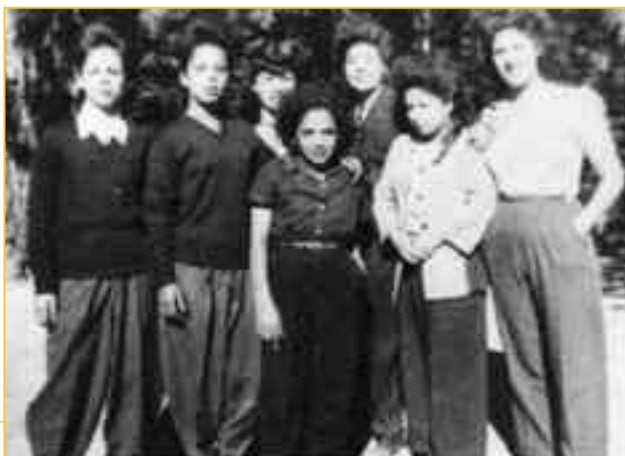
Οι πατσούκας εξεγέρθηκαν τόσο ενάντια στη ρατσιστική Αμερική όσο κι ενάντια στις παραδοσιακές αξίες των μεξικανικών κοινοτήτων.