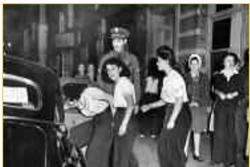
Φωτογραφία από την εφημερίδα Los Angeles Times στις 9/8/1942. Τρεις νεαρές πατσούκας συνελήφθησαν για άγνωστο λόγο και οδηγήθηκαν στο αστυνομικό τμήμα. Για το αμερικανικό κράτος και τη ρατσιστική μεσαία τάξη, οι πατσούκας αντιπροσώπευαν κάθε τι το αντιαμερικανικό και μάλιστα σε καιρό πολέμου. Ταυτόχρονα αντιπροσώπευαν μια ελευθεριότητα απαράδεκτη για μια εμπόλεμη κοινωνία, αλλά και για γυναίκες μεταναστευτικής καταγωγής.