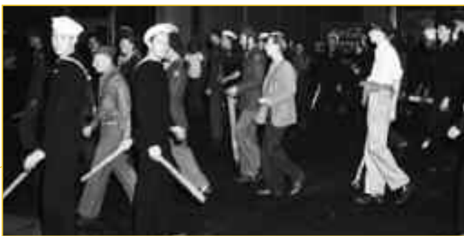
Ναύτες και ρουφιάνοι με γκλοπ έτοιμοι για πογκρόμ τον Ιούνιο του 1943 στο Λος Άντζελες.