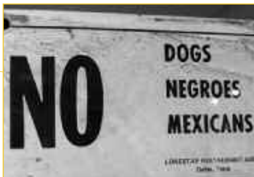
Τέτοιες πινακίδες υπήρχαν παντού στον αμερικανικό νότο κατά τον μεσοπόλεμο.