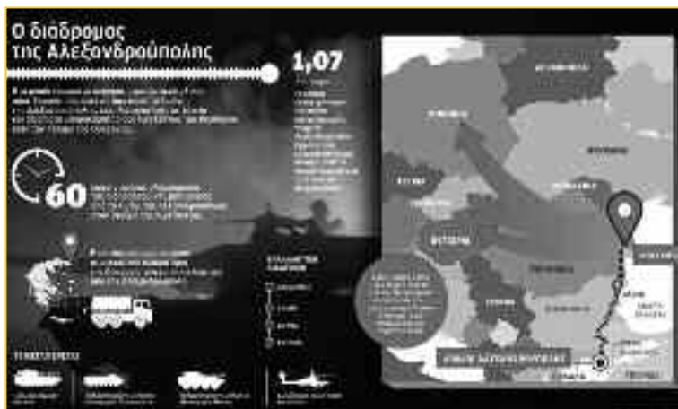
Εικόνα 6: Η σύνδεση Αλεξανδρούπολης-Βουλγαρίας θα παρακάμπτε τα στενά του Βοσπόρου παραβιάζοντας, εεε... παρακάμπτοντας τη συνθήκη του Μοντρέ. Η σιδηροδρομική γραμμή κολλητά στα ελληνοτουρκικά σύνορα δεν μας πειράζει. Αντίθετα, επειδή θα τη φυλάνε οι Αμερικάνοι, πρέπει να είναι όσο το δυνατόν κοντύτερα στα σύνορα. Όλα αυτά δημοσιεύονται με υπότιτλο «Η παράκαμψη των στενών προκαλεί νευρική κρίση στην Τουρκία». «Πυλώνες σταθερότητας» απ' τους λίγους!