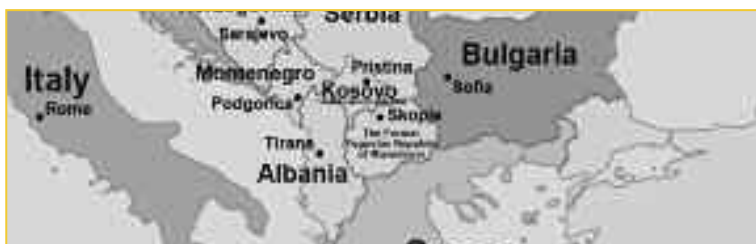
Εικόνα 3: Έπειτα από τριάντα χρόνια ενεργής ελληνικής ανάμιξης, η πυριτιδαποθήκη της Ευρώπης περιμένει την επομένη έκρηξη. Χάρη στην ανάμιξη του στις μεγαλύτερες σφαγές αμάχων στην Ευρώπη μετά τον Δεύτερο Παγκόσμιο Πόλεμο, το ελληνικό κράτος έχει αποκτήσει πάτημα στη Βόρειο Μακεδονία και στο Κόσοβο. Σε περίπτωση ανάγκης, το πάτημα θα λειτουργήσει ως αντίβαρο στην τουρκική και βουλγαρική επιρροή.

κατή ελληνική συμμετοχή στις μεγαλύτερες σφαγές αμάχων στην Ευρώπη μετά τον Β' Παγκόσμιο Πόλεμο, παραμένει ξεχασμένο και ανεξερεύνητο. Ότι το ζήτημα παραμένει σε εκκρεμότητα αναμένοντας το επόμενο ξέσπασμα στα «Δυτικά Βαλκάνια», παραμένει ανείπωτο (εικ. 3). 3 Ας κρατήσουμε τουλάχιστον ότι η ελληνική συμμετοχή στον Τέταρτο Παγκόσμιο Πόλεμο κρατάει από τότε που κανείς δεν τολμούσε να τον ονομάσει έτσι.