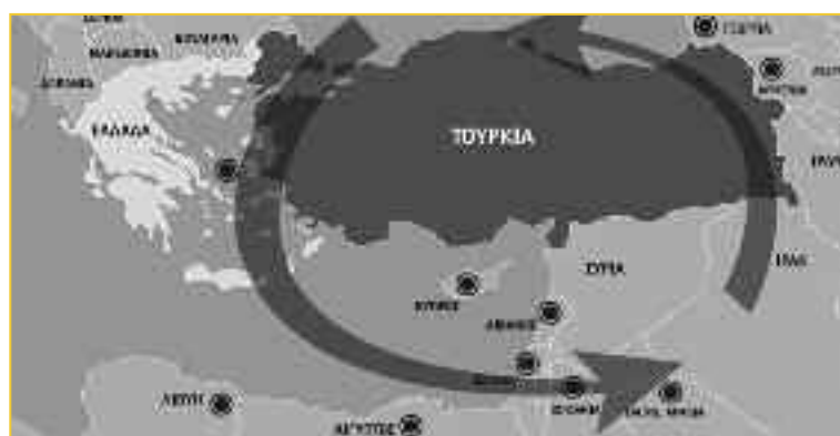
Εικόνα 5: Οι προσπάθειες «τριμερών συνεργασιών» του ελληνικού κράτους περικυκλώνουν την Τουρκία

Οι «τριγωνικές συνεργασίες» που ξεκίνησαν από το 2012 μαζί με την ανακάλυψη των πετρελαίων, είχαν όλες τους αντιτουρκικό προσανατολισμό. Τον Απρίλιο του 2017, είχαμε κάνει τον κόπο να τις βάλουμε σε ένα χάρτη (εικ. 5). Η εικόνα που προέκυπτε ήταν εύγλωττη. Πράγματι, για κάθε διάλυση κράτους που συμβαίνει στα πλαίσια της στρατηγικής της ανάσχεσης, εύκολα βρίσκουμε μια αντίστοιχη ελληνική «τριγωνική συνεργασία». Οι συνεργασίες με το Ισραήλ, την Ιορδανία και τη Σαουδική Αραβία αναφέρονται στη διάλυση της Συρίας και του Ιράκ και την ανάσχεση του Ιράν. Η συνεργασία με την Αίγυπτο αναφέρεται στη διάλυση της Λιβύης, όπου η Αίγυπτος (υποτίθεται ότι) δεν βλέπει με καλό μάτι την τουρκική ανάμιξη. Οι επαφές με την Αρμενία αναφέρονται στον πόλεμο Αρμενίας – Αζερμπαϊτζάν, όπου η Τουρκία υποστηρίζει το Αζερμπαϊτζάν. Η «συμφωνία των Πρεσπών» αναφέρεται στην τουρκική επιρροή στα Βαλκάνια μέσω Σερβίας και Βοσνίας. Επί τριάντα χρόνια, η εξέλιξη της «στρατηγικής της ανάσχεσης» βυθίζει την Τουρκία στις λάσπες του δικού της «εγγύς εξωτερικού». Το ελληνικό κράτος φροντίζει να αναμιχθεί στις λάσπες με όποιον τρόπο είναι εφικτός και συμφέρων.