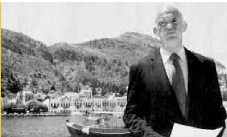
Εικόνα 1: Ο πρωθυπουργός ντύνεται βαρκούλα για να ζητήσει φράγκα. Το μελετημένο σκηνικό υπονοούσε τη νησιωτική φύση του ελληνικού κράτους.

Από το 2009 και μετά, όταν η πιο πρόσφατη φάση του Τέταρτου Παγκοσμίου Πολέμου άνοιξε για τα καλά, το ελληνικό κράτος φρόντισε να θυμίσει σε όλους τους τόνους ότι η επικράτειά του είναι νησί. Το θύμισε προς τα έξω, ντύνοντας τον Πρωθυπουργό βαρκούλα (εικ. 1). Το θύμισε και προς τα μέσα, εξοικειώνοντας τον πληθυσμό με τις έννοιες της «ΑΟΖ» και των «υποθαλάσσιων θησαυρών της Ανατολικής Μεσογείου». Ο χάρτης που κυκλοφόρησε άμεσα είναι σήμερα περισσότερο από εύγλωττος (εικ. 2).