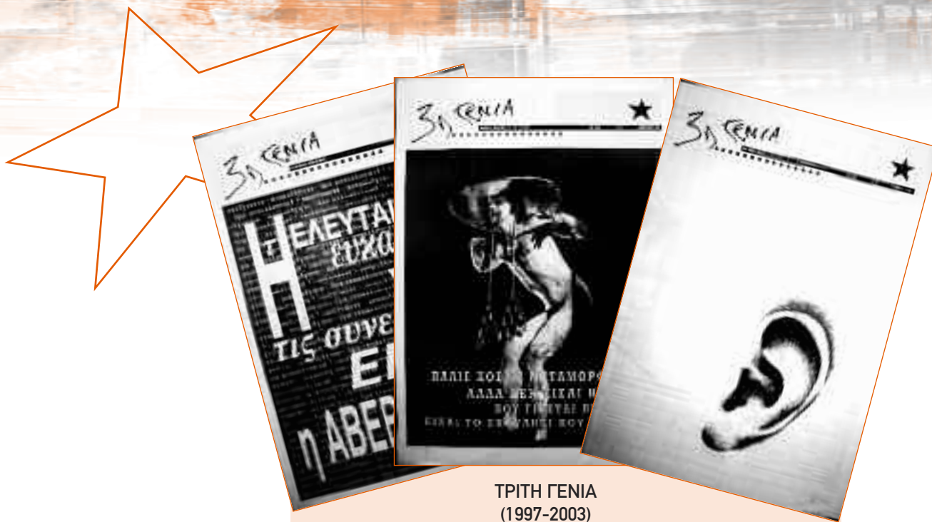
ΤΡΙΤΗ ΓΕΝΙΑ (1997-2003)

Οι αυτόνομες πολιτικές ομάδες επεδίωξαν να έχουν συγκεκριμένη γνώμη μέσα σε μια εποχή που αποθέωνε το «γενικώς κι αορίστως». Τόσο συγκεκριμένη, όσο συγκεκριμένη ήταν κι η επίθεση που εν τω μεταξύ εξελισσόταν εναντίον μας.