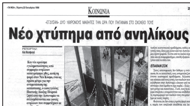
Εφημερίδα Τα Νέα, 22 Οκτωβρίου 1998

Πρέπει να το παραδεχτούμε ότι τα τελευταία χρόνια οι τηλεοπτικοί δέκτες έχουν πάρει φωτιά. Οπουδήποτε υπάρχει μια υποψία βίας στις γειτονίες, οι δημοσιογράφοι είναι εκεί για να ανακαλύψουν και μια συμμορία. Όλη αυτή η ανάλυση αριστοτεχνικά κατασκευάζει την εικόνα ενός φαινομένου το οποίο είναι υποτίθεται «πρωτοφανές», με την κατάσταση διαρκώς να χειροτερεύει. Σε αυτό το σημείο λοιπόν θα κάνουμε μια μικρή ιστορική αναδρομή. Θα πάμε... ελαφρώς πίσω στο χρόνο 25 περίπου χρόνια. Παραθέτουμε ενδεικτικά δύο άρθρα από την εφημερίδα Τα Νέα με χρονολογία 1998 και 2002 αντίστοιχα.