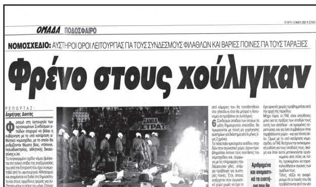
Εφημερίδα Τα Νέα, 15 Μαΐου 2002

Το πρώτο άρθρο μας ενημερώνει για «νέο κρούσμα εγκληματικότητας από συμμορία ανηλίκων στο Νέο Κόσμο» και ότι «ο εισαγγελέας ζητεί να συλλαμβάνονται και γονείς ανηλίκων που συμμετέχουν σε πράξεις βίας». Το δεύτερο μιλάει για ένα νομοσχέδιο που σκοπό έχει να αυστηροποιήσει τους όρους λειτουργίας των συνδέσμων και τις ποινές για τους χούλιγκαν. Παρατηρείτε κάποια ομοιότητα με το σήμερα; Ακριβώς! Αν αντικαθιστούσαμε απλά τις ημερομηνίες στα παραπάνω άρθρα με τη σημερινή τότε θα είχαμε δύο εντελώς αντιπροσωπευτικά άρθρα από αυτά που συναντάμε καθημερινά στις εφημερίδες, με ανηλίκους που πτακώνονται και γονείς που συλλαμβάνονται και νομοσχέδια για την αθλητική βία για να μαζευτούν οι χούλιγκανς που έχουν ξεφύγει.