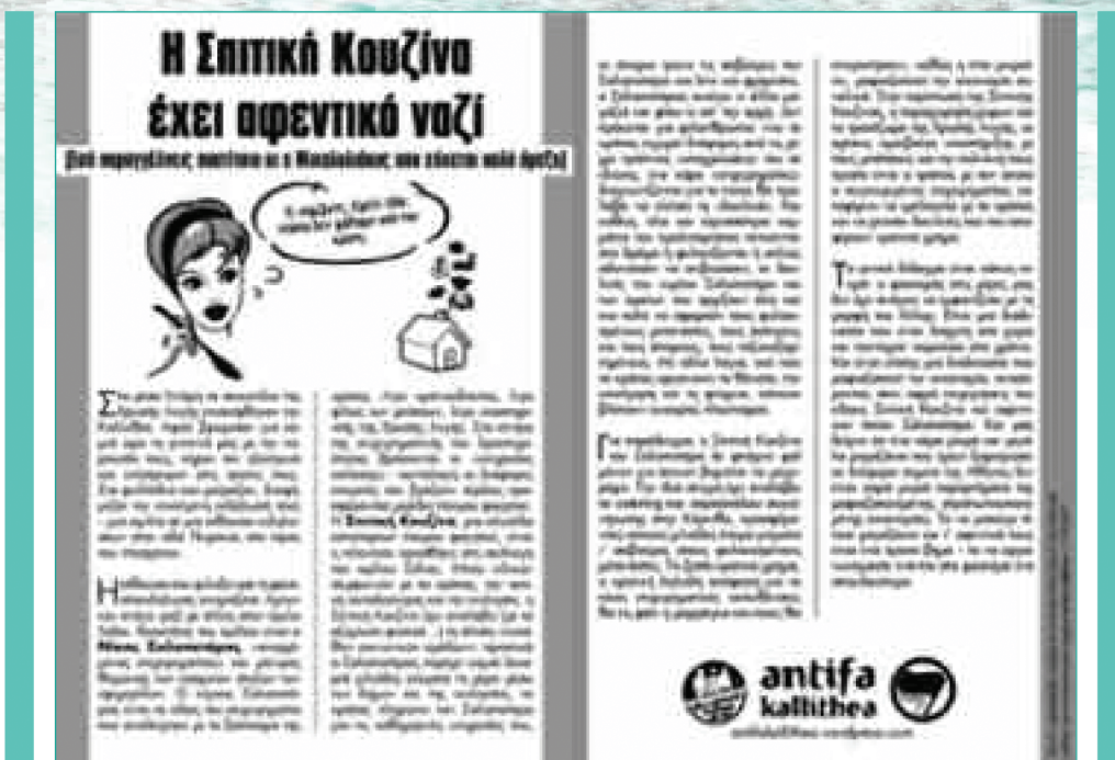
Προκήρυξη που μοιράστηκε από το Antifa Kallithea κατά την διάρκεια της συγκέντρωσης έξω από την «Σπιτική Κουζίνα», το 2017.