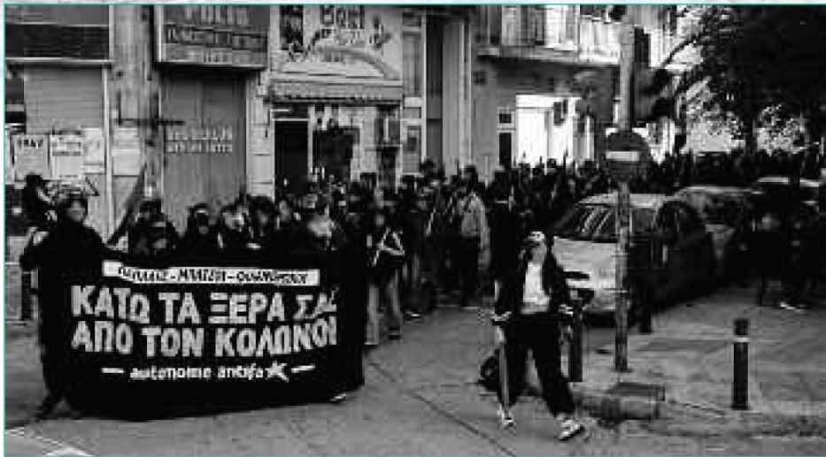
Δεκέμβριος 2022: Διαδήλωση στόμα με στόμα της αντιφασιστικής συνέλευσης autonome antifa με τίτλο «Παπάδες, μπάτσοι, φιλάνθρωποι, κάτω τα ξερά σας από τον Κολωνό!».

Σκοπός τους ήταν να εξοικειώσουν την εργατική τάξη με μία υγιεινή, πλην φθηνή, διατροφή, με μία μέθοδο που εφαρμοζόταν στην Γερμανία και είχε διαφύγει του Atwater: τις «Κουζίνες του Λαού», που παρήγαγαν φθηνά γεύματα για την εργατική τάξη. Το πρώτο τέτοιο εστιατόριο άνοιξε στη Βοστώνη, στο οποίο χρησιμοποιήθηκε μία εφεύρεση του Atkinson, που λεγόταν «Κουζίνα του Αλαντίν», που ήταν μία κουζίνα βραδείας καύσης με στόχο την εξοικονόμηση ενέργειας. Ο εκπαιδευτικός χαρακτήρας αυτού του εστιατορίου δεν ήταν ότι παρείχαν μαθήματα μαγειρικής, αλλά αφενός αρχιτεκτονικά η κουζίνα ήταν ανοιχτή προς το κοινό, ώστε να φαίνονται οι τρόποι μαγειρέματος και τα υλικά που χρησιμοποιούνταν. Αφετέρου, σκοπός του εστιατορίου ήταν να εξοικειώσει την εργατική τάξη με φαγητά, όπως η σούπα, που ήταν φθηνή και «θρεπτική».