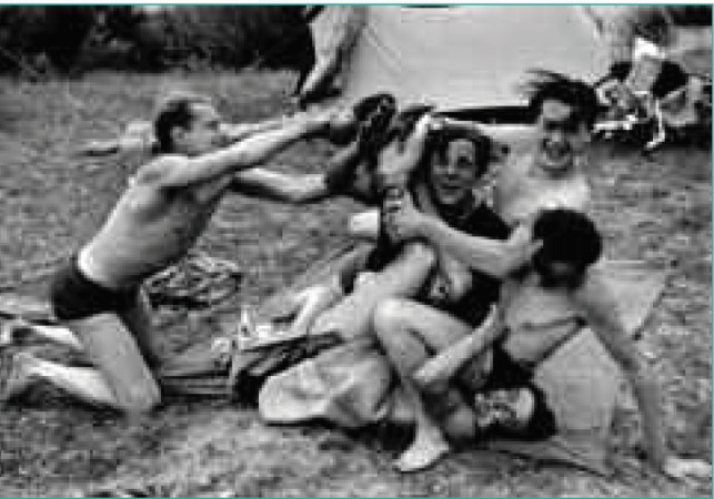
Φωτογραφία του 1936 τραβηγμένη από τον πολύ γνωστό φωτογράφο Henri-Cartier Bresson, στην οποία απεικονίζονται νεαροί με χαλαρή διάθεση που κάνουν διακοπές, με πληρωμένη άδεια, στον ποταμό Μάρνη. Η Γαλλία ήταν η πρώτη χώρα που θέσπισε τόσο εκτεταμένα την άδεια μετ' αποδοχών το 1936 με πρωτοβουλία των σοσιαλδημοκρατών.

τίες ποτέ δεν ήταν και τόσο φιλελεύθερες, τουλάχιστον όχι τόσο όσο οι ίδιες μας λένε ότι είναι. Αν κάποιος αφαιρέσει το εξωτερικό ιδεολογικό περιτύλιγμα, λοιπόν, θα δει ότι οι στρατηγικές τις οποίες ακολουθούσαν κατά τη δεκαετία του 1930 όλα τα κράτη που αργότερα πολέμησαν μεταξύ τους, είχαν απελπιστικές ομοιότητες μεταξύ τους. Παρομοίως και στις ΗΠΑ ο τουρισμός ήταν ένα εργαλείο, έτσι ώστε να συγκροτηθεί μια εθνική ταυτότητα καθώς κι η αίσθηση ενός κοινού σκοπού. Ο φιλόσοφος Μπέρτραντ Ράσελ θεωρούσε ότι το ζήτημα δεν ήταν οι διακοπές να είναι προνόμιο μόνο των πολύ πλούσιων. Αντιθέτως, αν οι συνηθισμένοι άνθρωποι, άντρες και γυναίκες, είχαν την ευκαιρία μιας ευτυχισμένης ζωής, θα τους έκανε πιο ευγενικούς και λιγότερο επιρρεπείς να βλέπουν τα πράγματα με καχυποψία. Ο τουρισμός, έλεγε, θα έφτιαχνε καλύτερους πολίτες επιτρέποντάς τους να ανακαλύψουν τις ομορφιές της χώρας τους, προωθώντας έτσι τον πατριωτισμό και μια αίσθηση εθνικής συνείδησης. 14