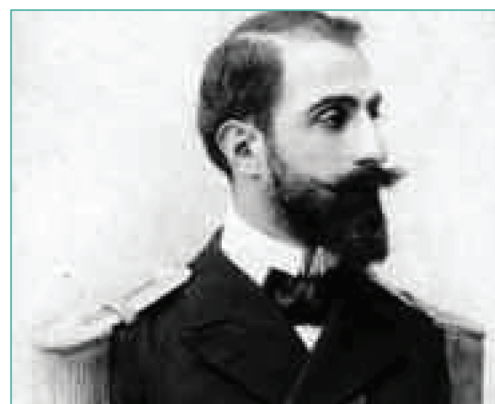
Ο Κωνσταντίνος Μελάς, προσωπικός φίλος του Ελευθέριου Βενιζέλου, αδερφός του μακεδονομάχου Παύλου Μελά, ήταν ο πρώτος πρόεδρος του ΕΟΤ. Με τις διεθνείς γνωριμίες του ανέλαβε να κάνει γνωστές τις ελληνικές ομορφιές στην οικουμένη. Πάντως αυτή η οικογένεια όλο προσωπικότητας έβγαζε.

Τον Ιούλιο του 1923, μια μεγάλη απεργία στο Λαύριο άνοιξε με ένταση το ζήτημα. Ο πρόεδρος της ένωσης εργοδοτών Ανδρέας Χατζηκυριακός υπεραμύνθηκε της στάσης των αφεντικών τονίζον-