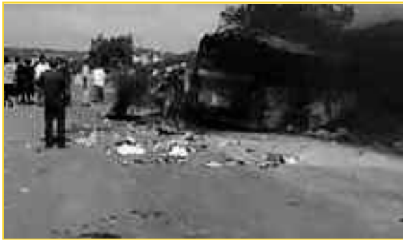
Ότι απέμεινε από το λεωφορείο που μετέφερε την ελληνική στρατιωτική-«ανθρωπιστική» αποστολή στη Λιβύη. Επισήμως ήταν ένα ατύχημα...

2022 η πρωθυπουργός της Ιταλίας Τζόρτζια Μελόνι έχει πάρει σβάρνα όλες τις χώρες της βόρειας Αφρικής προωθώντας συμφωνίες περαιτέρω οικονομικής συνεργασίας μεταξύ αυτών και με την Αλγερία. 4