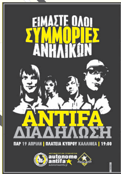
Αφίσα διαδήλωσης στις 19/4 στην Καλλιθέα από την συνέλευση autonome antifa.