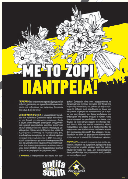
Αφίσα που κολληθήκε στις νότιες γειτονίες από το antifa south.