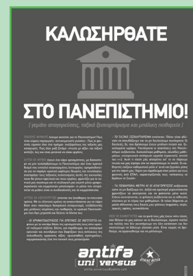
Αφίσα που τυπώθηκε και κολλήθηκε μέσα στον Οκτώβρη στα Πανεπιστήμια της Αθήνας απ' το Antifa Universus.

Μαζί με αυτό, διαπιστώσαμε πως όσα λέγαμε για τον ρόλο του Πανεπιστημίου όχι απλώς ίσχυαν, αλλά πως τα τελευταία χρόνια αυτός ο κρατικός θεσμός δείχνει όλο και πιο επιθετικά τα δόντια του. Πώς αλλιώς; Σε καιρούς κρίσης και πολεμικής προετοιμασίας, όπου επιβάλλονται πάνω μας σωρηδόν απαγορεύσεις, στερήσεις και πειθαρχία, το κρατικό Πανεπιστήμιο δεν θα μπορούσε να μείνει αλώβητο. Αντιθέτως, οργανώνεται με τέτοιους όρους ώστε να συμπορευθεί στην κρατική πολεμική προετοιμασία. Είτε αυτή η προετοιμασία αφορά τον πόλεμο στο εξωτερικό, είτε τον πόλεμο στο εσωτερικό, δηλα-