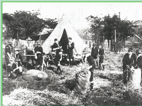
Πρόσκοποι ετοιμάζουν οχυρωματικά έργα και σκάβουν χαρακώματα στο Σπρίνγκχιλ, 1914.

Σαν σωστός ειδικός ο Μπένντεν-Πάουελ είχε και επιστημονικά διαγράμματα στο βιβλίο του. 2 μύρια αγόρια μείον 270.000 που μεγαλώνουν σε «νητικό περιβάλλον» μας κάνει 1 μύριο 730 χιλιάδες ανήλικους εγκληματίες. Απ' αυτούς κάποιοι θα γίνουν χούλιγκανς και κάποιιοι θα γίνουν πρόσκοποι. Ευτυχώς για το βρετανικό κράτος ο Μπένντεν-Πάουελ και οι όμοιοί του είχαν κάτι ιδέες τι να γίνει με την πάρτη τους.