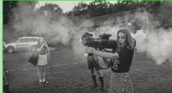
Νεαρή Ουκρανή εκπαιδεύεται στη χρήση όπλων σε ουκρανική κατασκήνωση. Δίπλα χαρούμενη φίλη της την τραβάει βίντεο. 2024. Πιθανότατα η τρομακτικότερη φωτογραφία της χρονιάς.