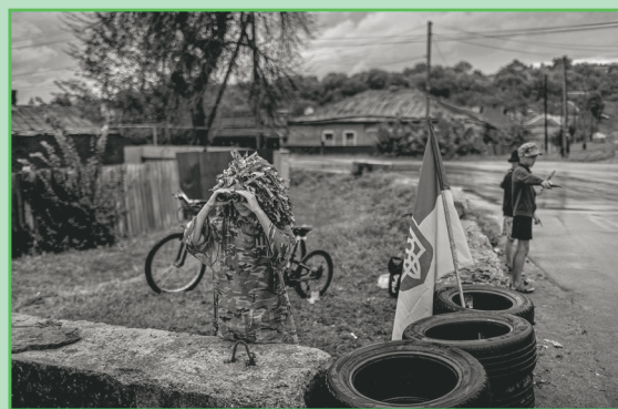
Παιδιά παίζουν παιχνίδι που αποκαλείται «σημείο ελέγχου» στα πλαίσια ουκρανικής κατασκήνωσης. Τους κανόνες ματέψτε τους μόνες σας. 2024.