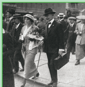
Ο Λόρδος Ρόμπερτ Μπένντεν-Πάουελ και η σύζυγός του βγαίνουν από το Υπουργείο Πολέμου, 1914.

Τα επόμενα χρόνια, καθώς το σφαγείο του δεύτερου παγκοσμίου πολέμου πλησίαζε, η πολεμική προετοιμασία εντάθηκε. Η προετοιμασία της ελληνικής κοινωνίας για τον Δεύτερο Παγκόσμιο Πόλεμο ήταν μια μακρά διαδικασία, που περιλάμβανε τη δικτατορία του Μεταξά, την ίδρυση της ΕΟΝ, την εξάσκηση στην πειθαρχία και πολλά άλλα που δεν χωρούν σ' αυτό το κείμενο. Στόχος ήταν η Ελλάδα να εμφανίσει «την ιδανική ει-