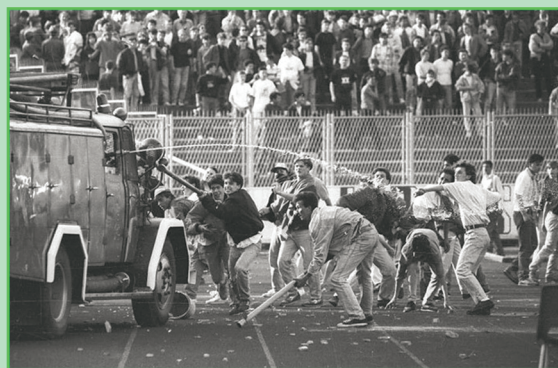
Γήπεδο Μάξιμρ, Μάιος 1990. Σέρβοι και Κροάτες οπαδοί συγκρούονται. Λίγο αργότερα πολλοί απ' τους συμμετέχοντες στα μπάχαλα είχαν πάψει να φορούν τα χρώματα των ομάδων τους και φορούσαν χακί.