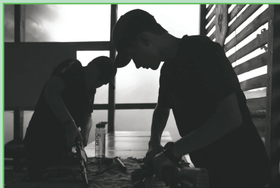
Συναρμολόγηση AK-47 σε ουκρανική κατασκήνωση, 2024.