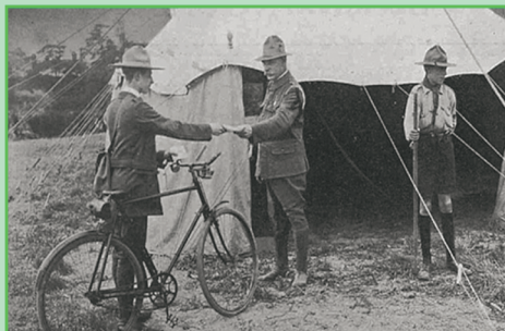
Πρόσκοπος με ποδήλατο παραδίδει στρατιωτική αλληλογραφία, 1914.