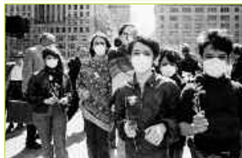
Νέα Υόρκη, Απρίλης 1970. Η γλώσσα του νέφους σε πλήρη λειτουργία.