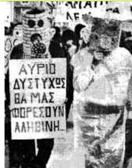
Αθήνα, Απρίλης 1981. Η γλώσσα του νέφους έχει εισβάλλει στα μυαλά των υπηκόων. Αλλά δεν έχει καταφέρει ακόμα να κυριαρχήσει πάνω στο χιούμορ. Κάνει ό,τι μπορεί όμως. Μέσα απ' τη μάχη παράγονται τρομερές προβλέψεις (έστω και στο παρεμπιπτόντως).