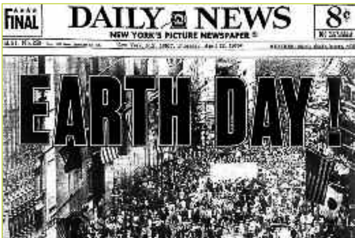
22 Απριλίου 1970. Η πρώτη «Ημέρα της Γης». Η ημερομηνία συμπίπτει με τα γενέθλια του Λένιν, κλείνοντας το μάτι στους πρώην «κινηματικούς».