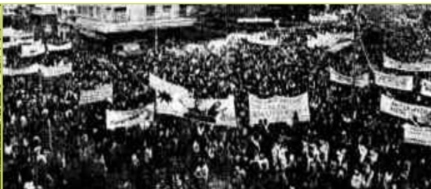
21 Απριλίου 1981. Διαδήλωση του Δήμου Αθηναίων ενάντια στο νέφος. Συμμετοχή 35.000 κόσμος. Κεντρικό σύνθημα «Το νέφος σκοτώνεται με μέτρα, όχι με λόγια». Η αριστερά δηλαδή υπερθεματίζει με το γνωστό πλέον επιχείρημα «τα μέτρα δεν είναι αρκετά». Και φυσικά επειδή εδώ είμαστε Βαλκάνια, η διαδήλωση έγινε μια μέρα νωρίτερα κι αντί για του Λένιν, η ημερομηνία συμπίπτει με τα γενέθλια της χούντας.

-Εκ περιτροπής κυκλοφορία των αυτοκινήτων τα σαββατοκύριακα (μονά-ζυγά).