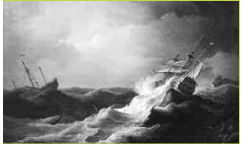
Peter Monamy, Ships in Distress in a Storm , 1720-1730. Ο πίνακας που χρησιμοποιήθηκε για το εξώφυλλο του βιβλίου.

Αναμενόμενα (μόνο όμως αν έχει ξαναδιαβάσει κανείς τέτοιο πράγμα), αυτή η περιήγηση στον «Ιμπεριαλισμό 1.01» είναι από τα πλέον επιμορφωτικά πράγματα που έχουμε διαβάσει. Ας πούμε η γεωγραφία - η περιγραφή του τρομερού ακρωτηρίου Χορν το 1741, μας δίνει να καταλάβουμε τη σημασία της Διώρυγας του Παναμά το 2024. Ας πούμε ο πόλεμος - ο αγγλοϊσπανικός «πόλεμος για το αυτί του Τζένκινς» ξέσπασε γιατί κάτι Ισπανοί είχαν κόψει το αυτί ενός Βρετανού εμπόρου πριν από επτά χρόνια - αυτό που σήμερα δείχνει ως ερασιτεχνισμός στην εξεύρεση «αιτίων πολέμου» αναδεικνύει τη σαθρότητα των σημερινών «αιτίων», αλλά και τη διαρκή προσπάθεια συγκάλυψης των αιτίων μέσω κρατικής προβοκάτσιας, από τότε που υπάρχει ιμπεριαλισμός. Ας πούμε η πολεμική τεχνολογία: οι περιγραφές της οργάνωσης της εργασίας σε ένα πολεμικό πλοίο αναδεικνύουν τον τρόπο με τον οποίο ο στρατός συνδέει το θάνατο, τις μηχανές και την οργάνωση της εργασίας. Ας πούμε η πολιτική: το Γουέιτζερ ναυαγεί και το