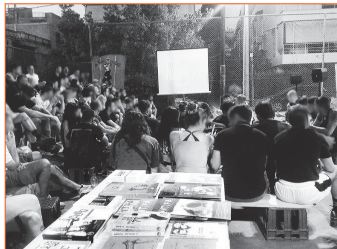
Εικ.1-2. Στα αριστερά, η αφίσα της εκδήλωσης που στάθηκε αφορμή για αυτό το κείμενο. Στα δεξιά, η εκδήλωση εν εξελίξει.

Κοινώς: απαραίτητο να κατανοείς θεωρητικά την λειτουργία των media, αλλά ζωτικό να μπορείς να εντοπίσεις πώς ο τοπικός τύπος συνδράμει στην κατασκευή του προβλήματος «νεανική εγκληματικότητα» στα μέρη σου με χειροπιαστά παραδείγματα (εικ. 3). Επίσης, χρήσιμο να έχεις εικόνα για τα αστυνομικά σχέδια σε εθνικό επίπεδο, αλλά εξαιρετικά σημαντικό να εντοπίζεις τους ειδικούς τρόπους με τους οποίους λειτουργούν στις γειτονιές που ξέρεις απ' έξω κι ανακατωτά (εικ. 4 & 5). Παρομοίως, κομβικό να γνωρίζεις ποιοι είναι αυτοί που πλαισιώνουν την κρατική επίθεση από το δικό τους μετερίζι, όταν μπορείς να τους ταυτίσεις με πρόσωπα και ομαδοποιήσεις που λόγω εγγύτητας είσαι εξοικειωμένος με τα συμφέροντά τους, τις επιδιώξεις τους και τους τρόπους οργάνωσής τους (εικ. 6). Και φυσικά, διαφωτιστικό να παρακολουθείς την «επιστημονική τεκμηρίωση» των κρατικών σχεδίων όταν αυτή αποπειράται να μιλήσει για φιγούρες και για τόπους που εσύ τους ζεις καθημερινά και είσαι γνώστης των φανερών και των κρυφών τους όψεων (εικ. 7).