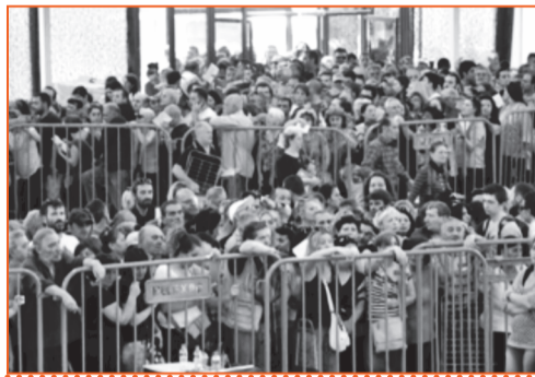
ΔΕΘ, Θεσσαλονίκη 2016: αναμονή και στήσιμο σε ουρές για διανομή ειδών διατροφής μέσω του προγράμματος ΤΕΒΑ.

Πέρα απ' το ίδιο το κτίριο βέβαια, η επιλογή της συγκεκριμένης περιοχής για την ίδρυση μίας υπερδομής «στήριξης των φτωχών» δεν ήταν τυχαία. Εκείνη τη περίοδο η εν λόγω περιοχή είχε βρεθεί στο επίκεντρο των αστυνομικών σχεδιασμών δημόσιας τάξης. Αυτοί οι σχεδιασμοί περιλάμβαναν από διαρκείς αστυνομικούς ελέγχους και εξακριβώσεις, μέχρι τη διεξαγωγή πογκρόμ, όπως αυτό του 2011. Σ' αυτούς τους σχεδιασμούς συσπειρώνονταν σύσσωμες