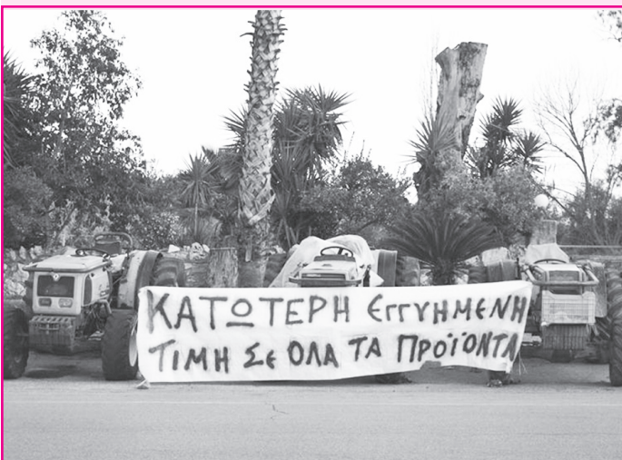
Τρακτέρ και αιτήματα για κρατικό προστατευτισμό.

31/10: Μεγάλη έρευνα σε όλη την Ε.Ε. αποκαλύπτει πως το 25% των τροχαίων ατυχημάτων σχετίζονται με την κατανάλωση αλκοόλ. Το συμπέρασμα είναι πως τα αλκοτέστ πρέπει να ενταθούν. Συγγνώμη, αλλά αφού με την ίδια έρευνα αποδεικνύεται πως το 75% των τροχαίων ατυχημάτων σχετίζεται με την έλλειψη κατανάλωσης αλκοόλ, δε θα ήταν πιο λογικό να απαγορευθεί η οδήγηση όταν είσαι νηφάλιος;