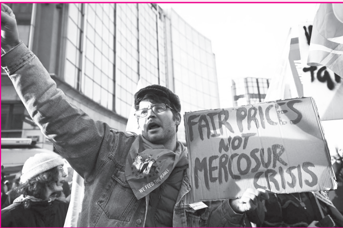
Αγρότες έξω από το κτίριο της Ευρωπαϊκής Ένωσης στις Βρυξέλλες. Το πλακάτ εννοεί: Μην πληρώνετε τους Λατινοαμερικανούς φτηνά, πληρώστε εμάς ακριβά!